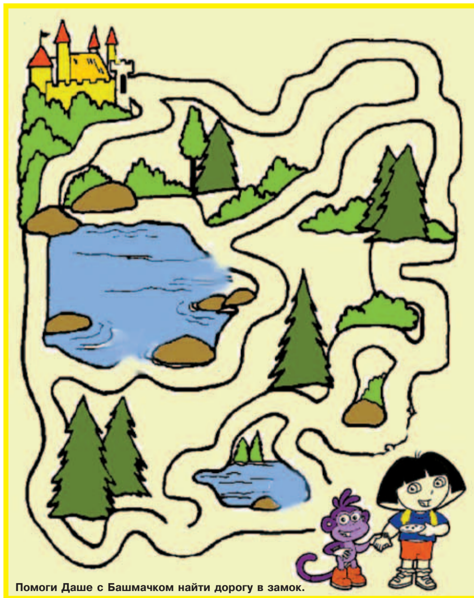
Помоги Даше с Башмачком найти дорогу в замок.