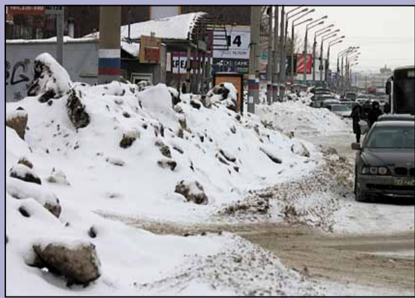
Репортёр идёт по городу