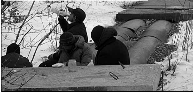
«Раздетая» теплотрасса по ул. Ермака вот уже много лет обгоревает... окрестных бомжей.

Знаем, что подобные проблемы одолели собственники жилья в многоквартирных домах и в других районах области. Берите пример с большереченцев! Только совместными действиями можно одолеть наступление монстра ЖКХ.